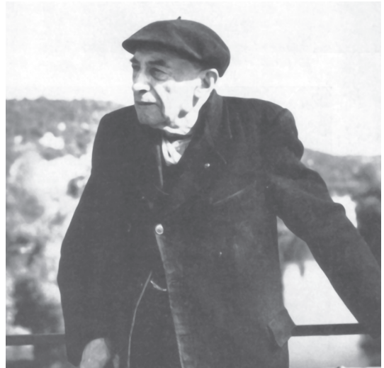
Fig. 2: Abbé Henri Breuil (1877-1961).

et la destinée humaine... Ces investigations et aspirations étaient en harmonie avec les interrogations de l'homme d'église. Leurs préoccupations métaphysiques respectives communes n'ont pu que favoriser leurs rencontres épistolaires.